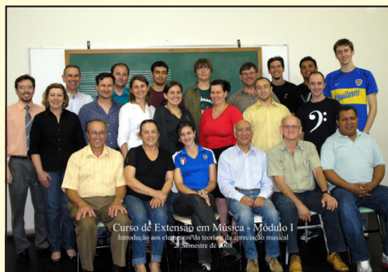
Curso de Extensão em Música - Módulo I Introdução aos elementos da teoria da apreciação musical 2º Semestre de 2008

O curso de Introdução aos Elementos da Teoria e da Apreciação Musical foi encerrado no dia 12 de novembro.